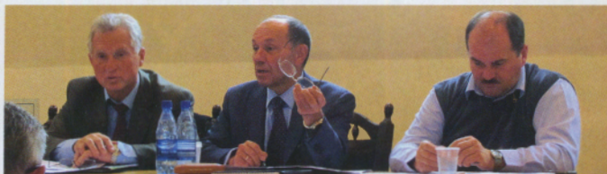
м. Київ «17» жовтня 2012 р.

засідання ради Федерації мисливського собаківництва України